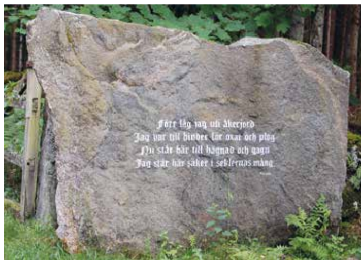
Den så kallade "Oxa-stenen". En odlingssten med en vers författad av en odlare i Södra Unnaryd, Småland 1842. Textningen är utförd av Walter Axelsson i Södra Säm år 2009.